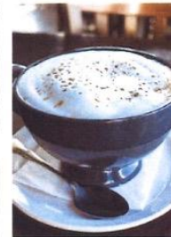
CAFÉ LATTE (BOL) 5$