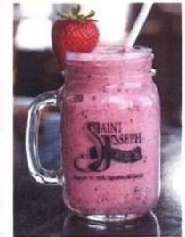
SMOOTHIE ST-JO 6$