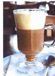
CAFÉ LATTE (TASSE) 4$